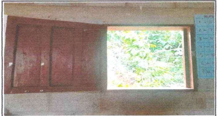
Foto 2: Sustitucion de ventanas: Ampliaremos la ventana para tener buena iluminacion.