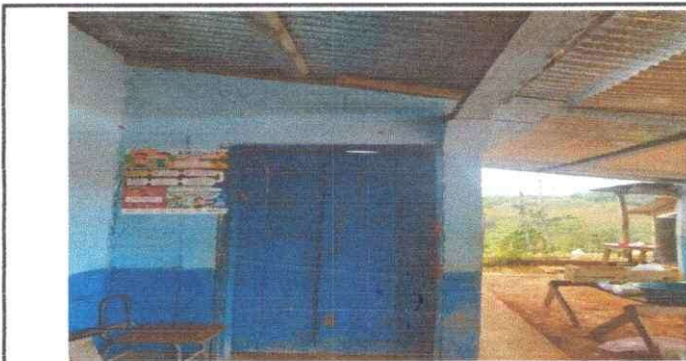
Foto 5: Sustitucion de puertas: Cambiaremos la puerta por una de metal.