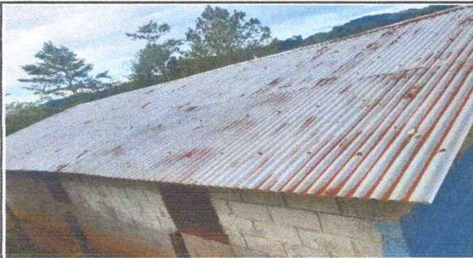
Foto1: Cambio del techado del establecimiento