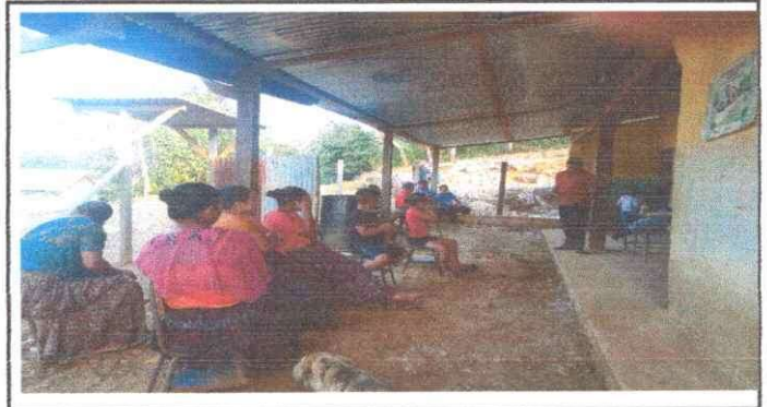
Foto 4: Colocacion de pisos, Reuniones en el corredor alrededor del polvo